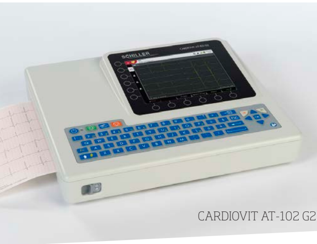
CARDIOVIT AT-102 G2