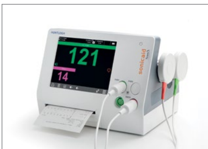
TEAM3 - A/P

Die TREND-Intrapartumfunktion zeigt periodische Veränderungen der FHR deutlich an. Trenderstellung aus Basalfrequenz, STV und Dezelerationen zur Unterstützung bei der CTG Auswertung. Behalten Sie diese Kernwerte stets im Blick.