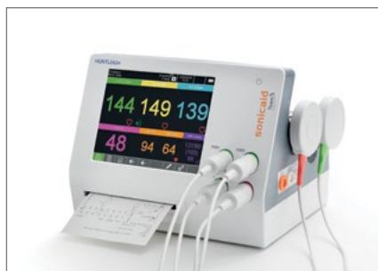
TEAM3 - I/P

Antepartum- und Intrapartum-Modelle in Einzel-, Zwillings- oder Drillingskonfiguration. Mit maternalen Vital Parametern und integriertem Akku erhältlich.