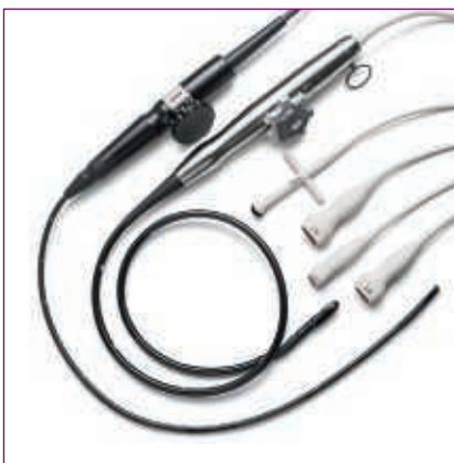
Speziell für kardiovaskuläre Anwendungen

Ergonomisches Design mit leichten, sehr flexiblen Kabeln