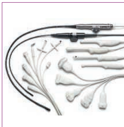
Umfangreiche Palette an Schallköpfen für die Sonographie