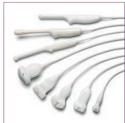
Für Anwendungen in der Frauenheilkunde entwickelt